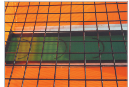
Der Streuer ist mit einem profilierten Förderband ausgestattet um eine gleichmäßigere Entleerung des Behälters zu erzielen.