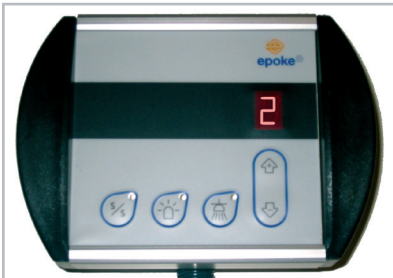
Die EpoSet Fernbedienung wird im Fahrerhaus montiert für die Bedienung von Start/Stopp der Streuung, der Streubreite, Rundumkennleuchte und Arbeitslicht.