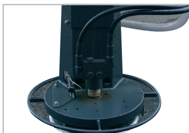
Spredeskive og tragt er fremstillet i rustfrit, lakeret stål.