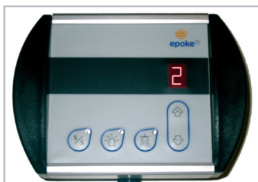
EpoSet fjernbetjening monteres i førerhuset til betjening af start/stop af spredning, spredbredde, rotorblink og arbejdslampe.